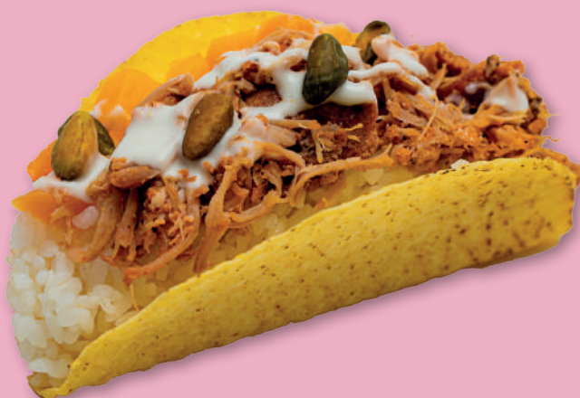
PRINCESS TACOS 5,50€ Riso bianco, pulled pork, zucca, salsa yogurt, pistacchi (TORTILLAS MORBIDA SU RICHIESTA)