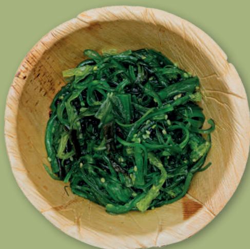
GOMA WAKAME 3,50 €