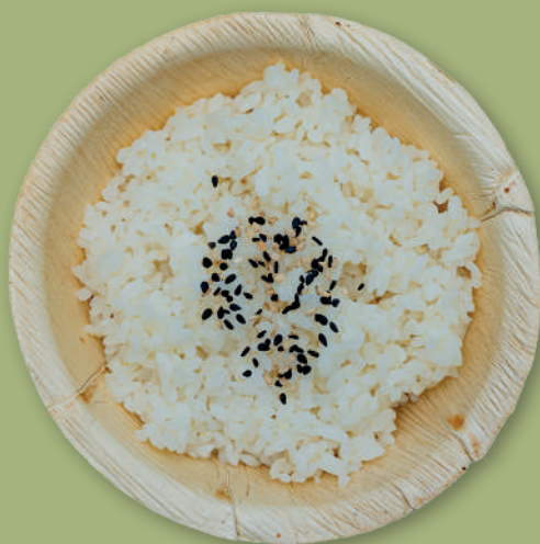
RISO BIANCO 3,00€