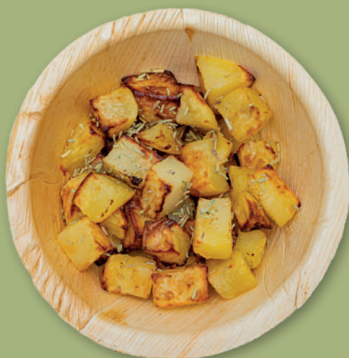
PATATE ARROSTO 3,00€ con salsa rosa e cipolla frita (+0,50€)