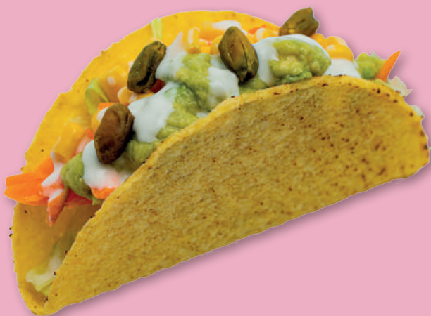
VEGGIE TACOS 4,50€ Insalata, carote, smashed avocado, mais, salsa yogurt, pistacchi (TORTILLAS MORBIDA SU RICHIESTA)