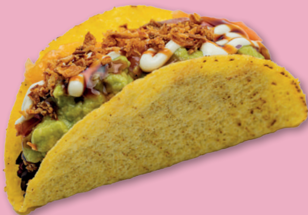
QUEEN TACOS 5,50€ Riso nero, salmone affumicato, smashed avocado, salsa maio e teriyaki, cipolla frita (TORTILLAS MORBIDA SU RICHIESTA)